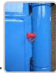
Alle beweglichen Teile sind mit Schmiemippen versehen