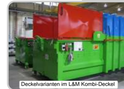
Deckelvarianten im L&M Kombi-Deckel