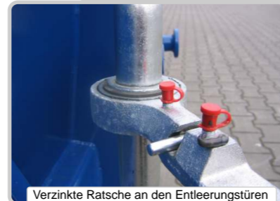
Verzinkte Ratsche an den Entleerungstüren