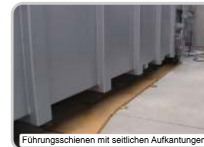
Führungsschienen mit seitlichen Aufkantungen