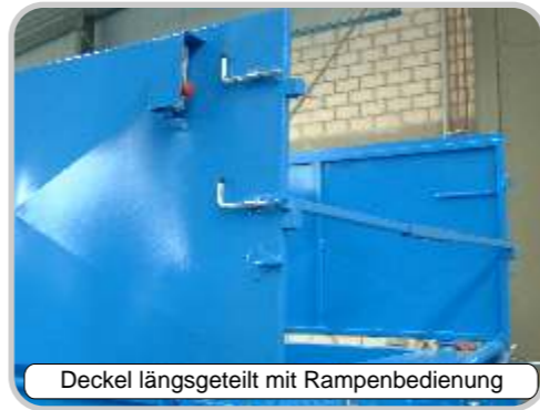
Deckel längsgeteilt mit Rampenbedienung