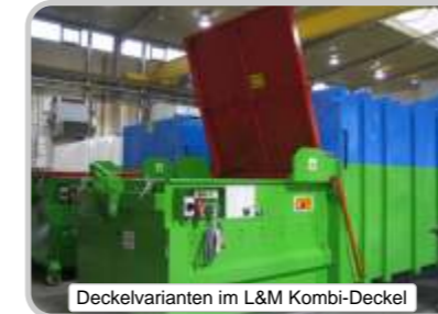
Deckelvarianten im L&M Kombi-Deckel