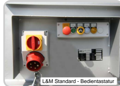
L&M Standard - Bedientastatur