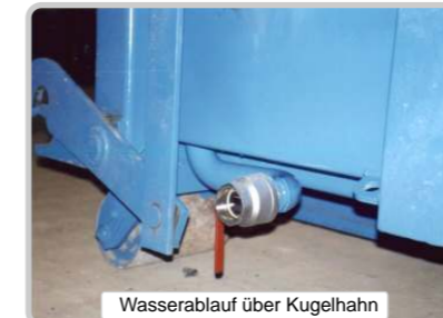
Wasserablauf über Kugelhahn