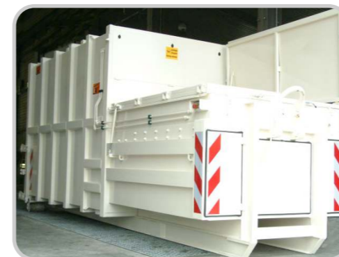
Sonderausführung FEUCHT MÜLL