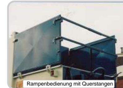
Rampenbedienung mit Querstangen