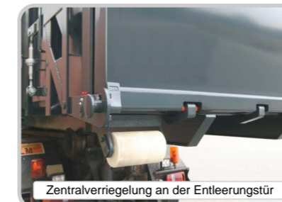
Zentralverriegelung an der Entleerungstür