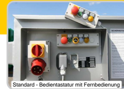
Standard - Bedientastatur mit Fernbedienung