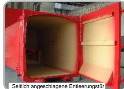
Seitlich angeschlagene Entleerungstür