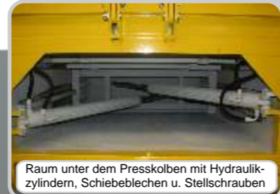
Raum unter dem Presskolben mit Hydraulikzylindern, Schieblechen u. Stellschrauben