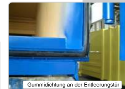
Gummidichtung an der Entleerungstür