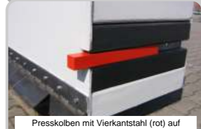
Presskolben mit Vierkantstahl (rot) auf Polyamiden (schwarz) und Stahlabstreifern