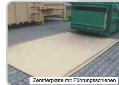
Zentrierplatte mit Führungsschienen