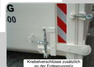
Knebelverschlüsse zusätzlich an der Entleerungstür