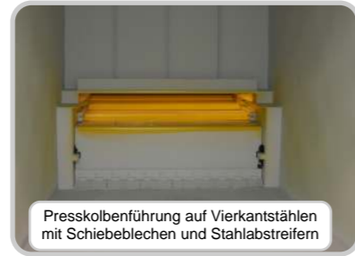
Presskolbenführung auf Vierkantstäben mit Schieblechen und Stahlabstreifern