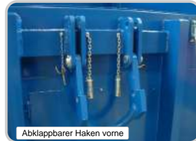
Abklappbarer Haken vorne